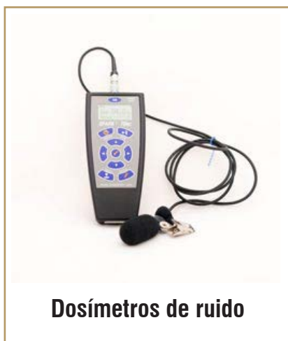
Dosímetros de ruido