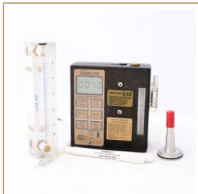
Bombas de muestreo Personal