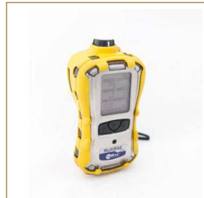
Detector de gases