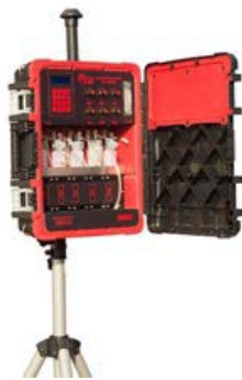
Trenes de muestreo