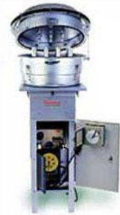
Muestreador de partículas de alto volumen