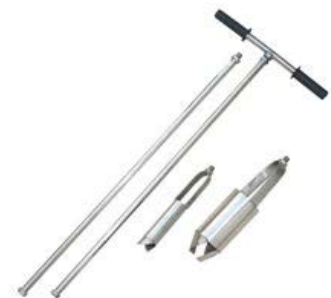
Barrenos muestreadores de suelos