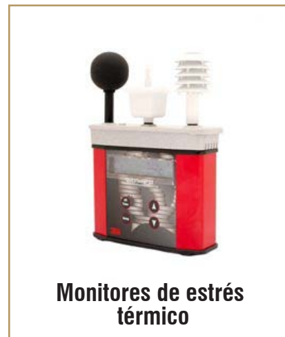
Monitores de estrés térmico