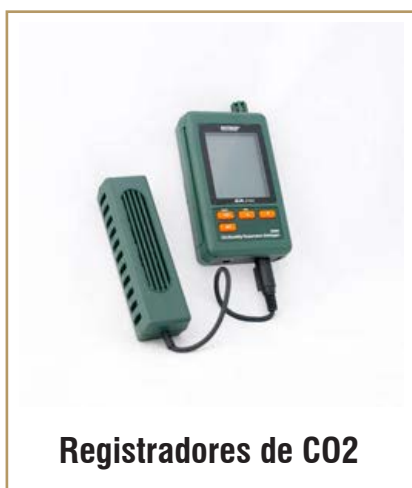
Registradores de CO2